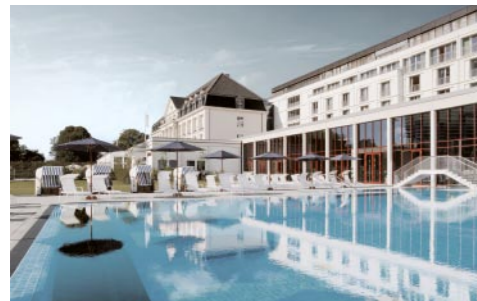
COLUMBIA, A-Rosa Hotel und Maritim: Top-Hotels der Travemünder Szene